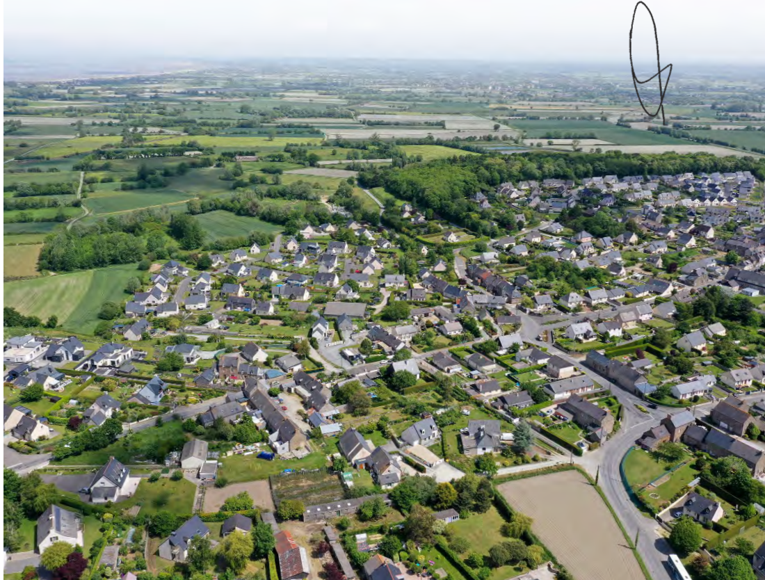
Bourg de La Gouesnière depuis la rue de la Gare, en direction du bois Renou et du marais