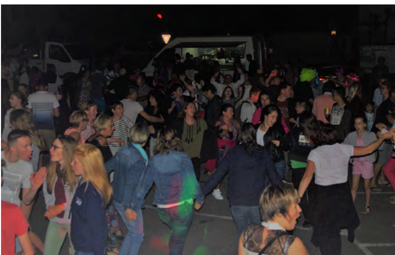
Pour la quatrième année consécutive, la fête de la musique s'est déroulée sur la place Joseph Viel le samedi 15 juin 2019.

Cette année, nous avons le plaisir de vous informer que les associations ont répondu favorablement à la proposition de la municipalité d'organiser des animations dans le cadre du téléthon . Celles-ci auront lieu le vendredi 29 et le samedi 30 novembre 2019 .