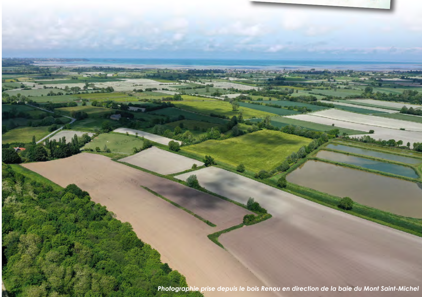
Photographie prise depuis le bois Renou en direction de la baie du Mont Saint-Michel