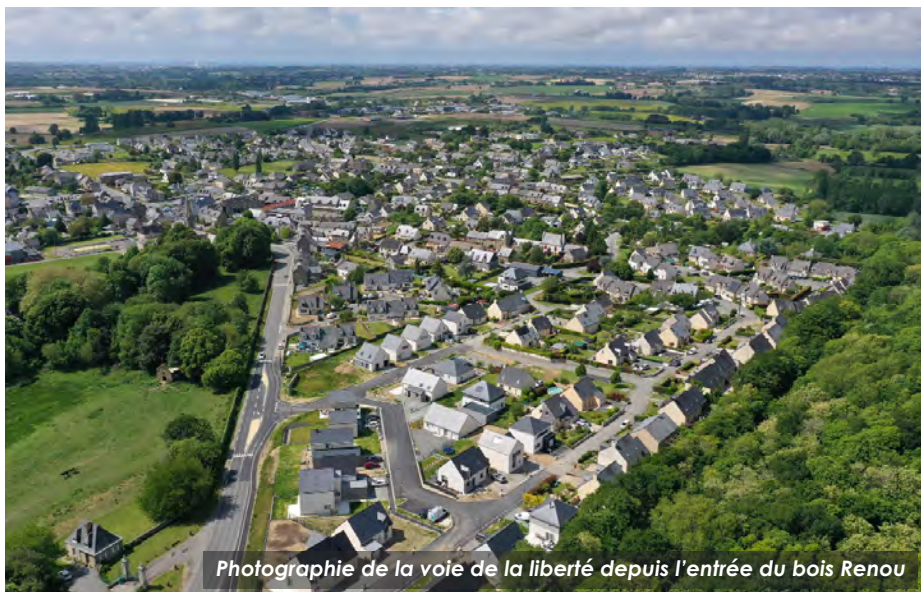
Photographie de la voie de la liberté depuis l'entrée du bois Renou

Une deuxième tranche de travaux d'aménagement du bourg a débuté cette année au niveau de la voie de la Liberté, située depuis l'entrée du bois Renou jusqu'à l'église. Ce chantier va se poursuivre à l'automne par la création de places stationnement et de trottoirs qui vont sécuriser les piétons.