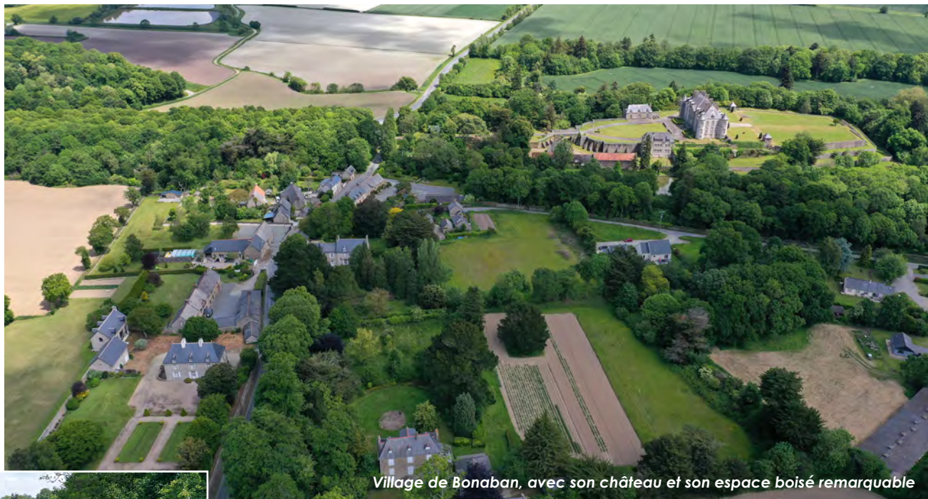
Village de Bonaban, avec son château et son espace boisé remarquable